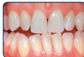
Resultaat na tien dagen bleken met de thuisbleekmethode onder supervisie van de tandarts