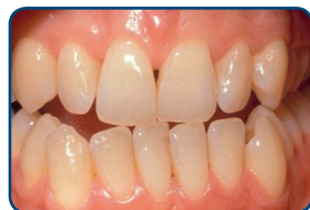
Voor het bleken

De lengte van een bleekbehandeling hangt af van de bleekmethode. Bij de thuisbleekmethode duurt het meestal twee tot drie weken voordat je het gewenste resultaat hebt bereikt. De tandkleur wordt na het beëindigen van de bleekbehandeling altijd weer iets donkerder. Na zes weken kun je pas het echte bleekresultaat zien.