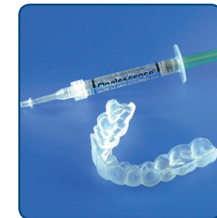
Van de tandarts of mondhygiënist krijg je de doorzichtige bleeklepel en de gel met de blekende werking mee naar huis

Egale, niet te ernstige verkleuringen kun je van buitenaf bleken. Dat gebeurt met behulp van een bleeklepel. Eerst maakt de tandarts of mondhygiënist een afdruk van je gebit. Hiermee maakt de tandtechnicus in het tandtechnisch laboratorium een bleeklepel van een zachte transparante kunststof, die precies over je gebit past en ruimte laat voor de gel. Dat is belangrijk, om irritatie van het tandvlees te voorkomen. De bleeklepel is de mal waarmee je de blekende gel op de tanden aanbrengt. De gel bevat 3 tot maximaal 6% waterstofperoxide. Na een goede instructie hoe je de gel moet aanbrengen en wanneer je de bleeklepel moet dragen, krijg je de bleeklepel en enkele spuitjes bleekgel mee naar huis.