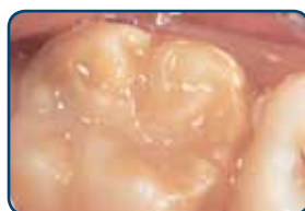
Kaaskies in het blijvend gebit