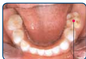
Kaaskies in het melkgebit

Kinderen met kaaskiezen hebben meer gaatjes dan leeftijdsgenoten zonder kaaskiezen. Heeft een kind kaaskiezen in zijn melkgebit? Dan heeft het een grotere kans op de ontwikkeling van kaaskiezen in zijn blijvend gebit. In Nederland heeft 5-9% van de kinderen kaaskiezen in het melkgebit. In het blijvend gebit heeft 9-14% van de kinderen één of meerdere kaaskiezen. Kinderen met kaaskiezen in het blijvend gebit, hebben ook kans op een wit-gele verkleuring van de blijvende voortanden.